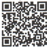
กลุ่ม Facebook DOPA S.W.A.T. ๖๖