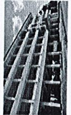
อาคารสถานที่สอบ