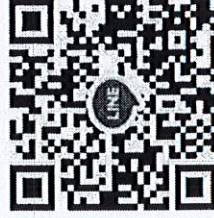
สไตล้วยเกียณ ๒๕๖๖

หมายเหตุ ๑. กรุณาส่งแบบตอบรับทาง e-mail : dopahrwelfare@gmail.com