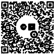
QR Code LINE Open Chat