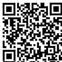
กลุ่ม Facebook DOPA S.W.A.T. ๖๗