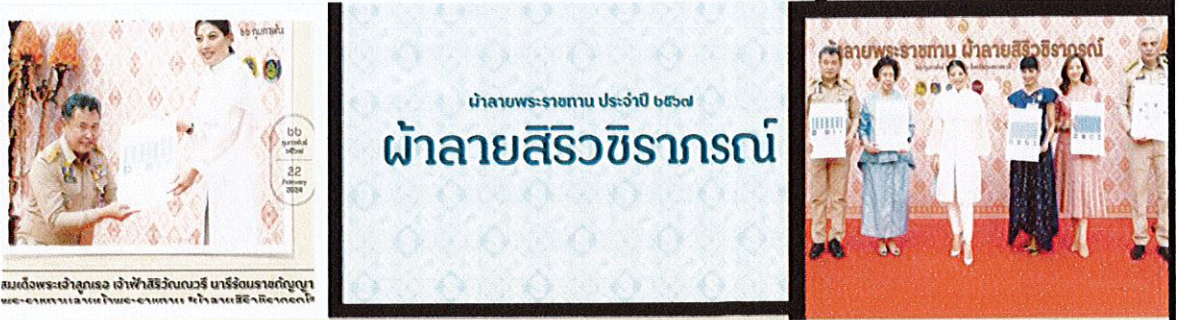
สมเด็จพระเจ้าลูกเธอ เจ้าฟ้าสิริวัณณวรี นารีรัตนราชกัญญา พระราชทานลายผ้าพระราชทาน ผ้าลายสิริวัชรารักษ์

เนื่องในโอกาสมหามงคลเฉลิมพระชนมพรรษา พระบาทสมเด็จพระปรเมนทรรามาธิบดี ศรีสินทรมหาวชิราลงกรณ พระวชิรเกล้าเจ้าอยู่หัว ทรงเจริญพระชนมพรรษา 6 รอบ 72 พรรษา สมเด็จพระเจ้าลูกเธอ เจ้าฟ้าสิริวัณณวรี นารีรัตนราชกัญญา ได้ทรงศึกษา ค้นคว้าลวดลายผืนผ้าจากทุกภูมิภาคทั่วประเทศ และทรงนำมาออกแบบลายพระราชทานเนื่องในปมหามงคลนี้ โดยมีลายพระราชทานหลักจำนวน 4 ลาย ผ่านทางกระทรวงมหาดไทย เมื่อวันที่ 22 กุมภาพันธ์ 2567 ณ จังหวัดอุบลราชธานี