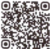
QR Code สำหรับ ดาวน์โหลดเอกสาร