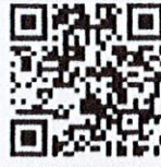
ระบบการเสนอขอพระราชทานฯ

๓) มอบหมายเจ้าหน้าที่ผู้รับผิดชอบ ดำเนินการยื่นคำขอให้บุคลากรในสังกัดผ่านระบบการเสนอขอพระราชทานเหรียญพิทักษ์เสรีชน ปค. ได้ที่ http://mis4.dopa.go.th/0301/decoration ตั้งแต่วันที่ ๑ - ๒๔ พฤษภาคม ๒๕๖๗ พร้อมรวบรวมเอกสารประกอบการเสนอขอพระราชทานฯ ทั้งนี้ สำหรับชื่อผู้ใช้งาน (Username) และรหัสผ่าน (Password) เป็นชื่อผู้ใช้งานเดียวกันกับการเสนอขอพระราชทานเครื่องราชอิสริยาภรณ์ และเหรียญจักรพรรดิมาลา ประจำปี พ.ศ. ๒๕๖๗