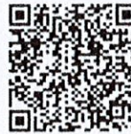
ช่องทางการจัดส่งเอกสารฯ

๔) จัดส่งรายชื่อผู้สมควรได้รับการเสนอขอพระราชทานเหรียญพิทักษ์เสรีชน พร้อมหนังสือ นำส่ง และเอกสารประกอบการเสนอขอพระราชทานเหรียญพิทักษ์เสรีชน ครั้งที่ ๒ ประจำปี พ.ศ. ๒๕๖๗ ให้สำนักงานเลขาธิการกรม กรมการปกครอง ภายในวันที่ ๓๑ พฤษภาคม ๒๕๖๗ ผ่านช่องทาง Google Forms ตาม QR Code “ช่องทางจัดส่งเอกสารฯ” ในรูปแบบไฟล์ PDF สำหรับหนังสือฉบับจริง ขอให้ สำนัก/กอง และที่ทำการปกครองจังหวัด เก็บรักษาไว้ที่หน่วยงานต้นสังกัดเพื่อใช้เป็นหลักฐานในกรณีที่มีความจำเป็นต้องตรวจสอบ