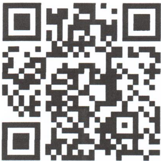
รายละเอียดโครงการฯ

สามารถดาวน์โหลดรายละเอียดโครงการฯ ตราสัญลักษณ์ฯ แบบตลปัตร และย้อม ที่ใช้สำหรับโครงการบรรพชาอุปสมบท เฉลิมพระเกียรติพระบาทสมเด็จพระเจ้าอยู่หัว เนื่องในโอกาสพระราชพิธีมหามงคลเฉลิมพระชนมพรรษา ๖ รอบ ๒๘ กรกฎาคม ๒๕๖๗