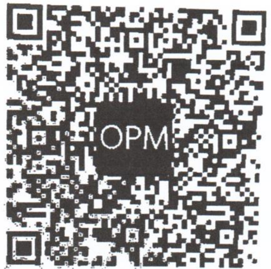
ตราสัญลักษณ์ฯ