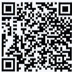
สิ่งที่ส่งมาด้วย