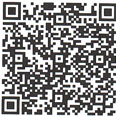
แบบรายงานสำรวจที่ตั้งตลาดโครงการฟื้นฟูเศรษฐกิจ