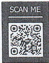
แบบฟอร์มการทดสอบความชัดเจน (ว.๑๖)

รองปลัดกระทรวงมหาดไทย ปฏิบัติราชการแทน ปลัดกระทรวงมหาดไทย