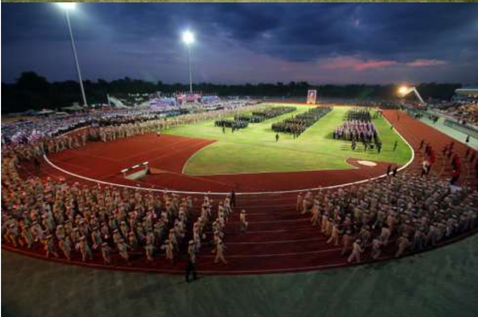
"ปวงข้าพระพุทธเจ้า ขอน้อมเกล้าน้อมกระหม่อม รำลึกในพระมหากรุณาธิคุณหาที่สุดมิได้"