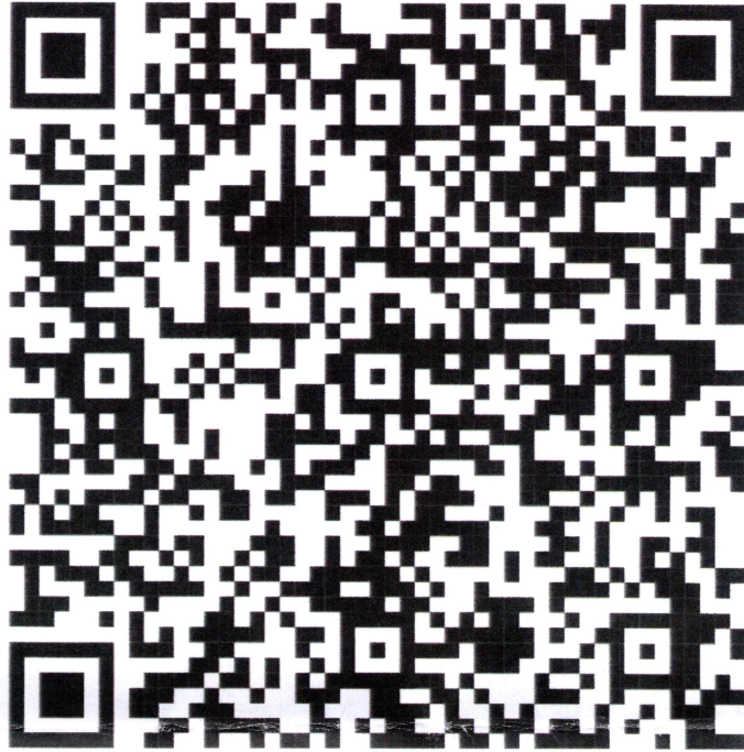
สิ่งที่ส่งมาด้วย ๑-๖

ตามหนังสือกรมการปกครอง ด่วนที่สุด ที่ มท ๐๓๐๕.๑/ว.๖๖๖๗ ลงวันที่ ๑๐ ตุลาคม ๒๕๖๗ เรื่อง การดำเนินโครงการสนับสนุนการบูรณาการและการขับเคลื่อนนโยบายในระดับอำเภอ ประจำปีงบประมาณ พ.ศ. ๒๕๖๘ งวดที่ ๑ (ไตรมาสที่ ๑ - ๒)