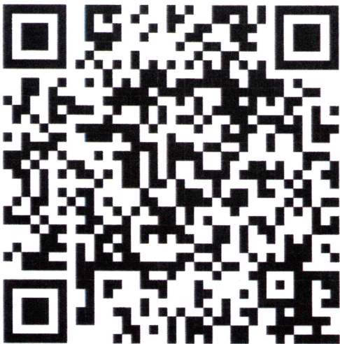
แบบรายงานข้อมูล กิจกรรม/โครงการ Google Forms