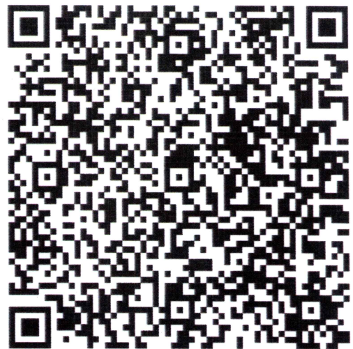
ผลการบันทึกข้อมูล กิจกรรม/โครงการ Google Sheets