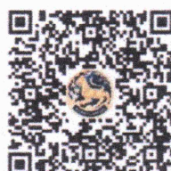
เอกสารที่เกี่ยวข้อง