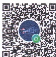
Line OA “ไทยช่วยไทย ปค.”