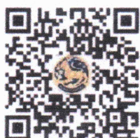
แบบรายงาน (Google Forms)