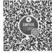
อำเภอในจังหวัดพื้นที่ภาค ๖