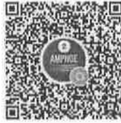
อำเภอในจังหวัดพื้นที่ภาค ๒