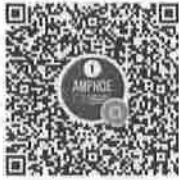
อำเภอในจังหวัดพื้นที่ภาค ๑