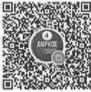
อำเภอในจังหวัดพื้นที่ภาค ๔