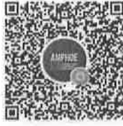
กลุ่มรวมอำเภอทั่วประเทศ รวม ๘๗๘ อำเภอ