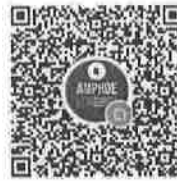
อำเภอในจังหวัดพื้นที่ภาค ๘