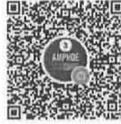
อำเภอในจังหวัดพื้นที่ภาค ๓