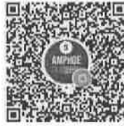
อำเภอในจังหวัดพื้นที่ภาค ๕