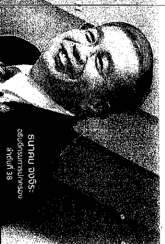
สุภานม ดนตรี อธิบดีกรมการปกครอง หน้าที่ 38

คู่มือของหน่วยงาน คือ กู้ให้ประชาชน ทุกชั้นของ สุขภาพชั้น